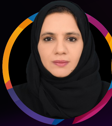
المحاور أحلام الطوبى